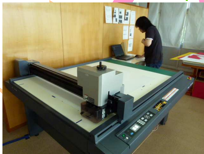
プロッターを使用して課題制作