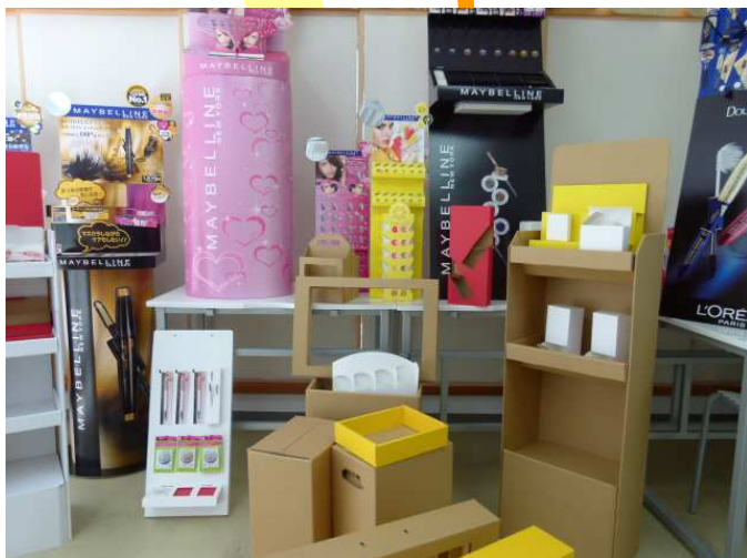
お手本と実習課題