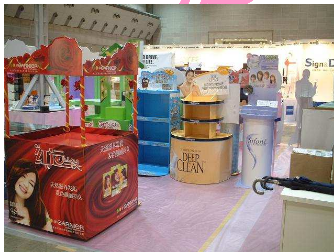
将来の目標！(商品展示会の様子)