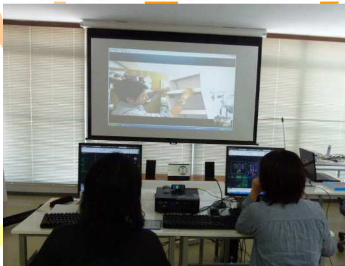
講師(東京)との遠隔授業風景